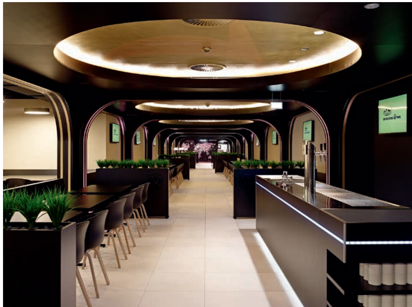
Restaurant- und Barbereich mit Bogenkonstruktionen.