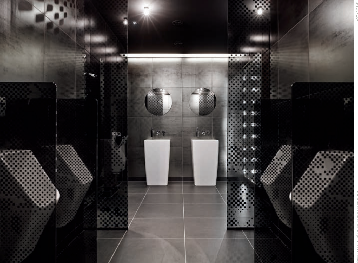
Herren WC-Bereich mit Monoblockwaschtischen der Serie Metropole und Urinalen der Serie S20.