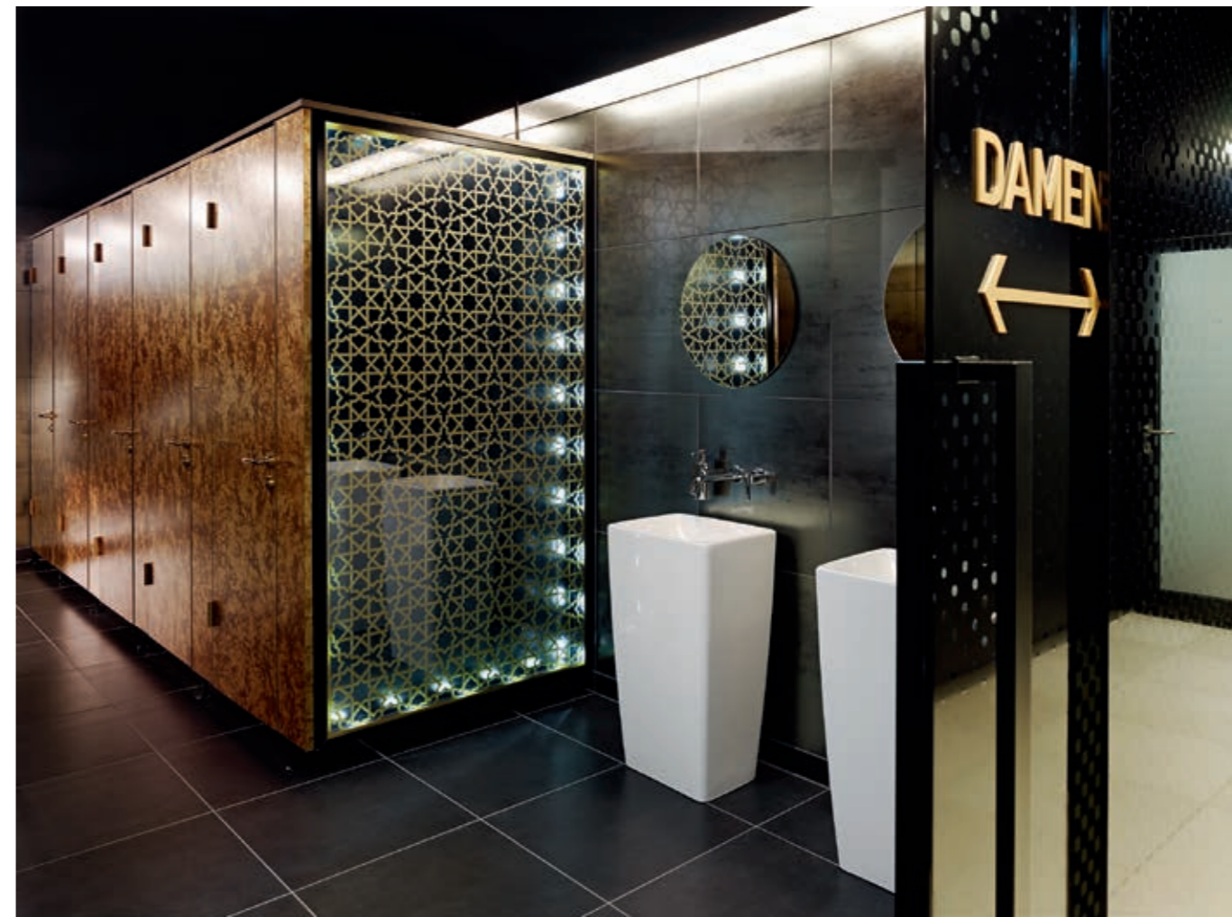
Der durch Glaswände abgeteilte Damen WC-Bereich.